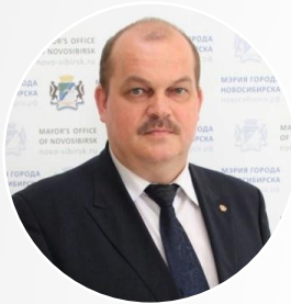
Ахметгареев Рамиль Миргазынович начальник департамента образования мэрии города Новосибирска